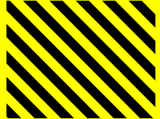
WIRD BEKANNT GEGEBEN