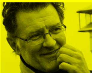
JEAN-PHILIPPE VASSAL Architekt, Partner bei Lacaton&Vassal, Professor Frankreich // Tätig in Paris www.lacatonvassal.com